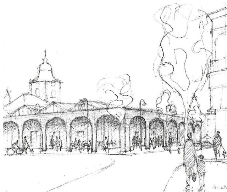
Vue sur le parking de la Cure depuis la rue Jules Hans

Lors de la journée de consultation citoyenne proposée par Ecolo le 18 novembre, parmi les nombreux thèmes de préoccupation des riverains, un constat fort a émergé : le centre-ville manque d'un endroit rassembleur. Au fil des discussions est née l'idée de créer une halle multifonctions qui attirerait différents publics et créerait du lien social. Ecolo Braine-l'Alleud a décidé de soutenir, porter et développer plus avant cette idée.